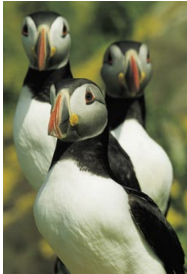
links: „Margariten im Wind“ Nikon D200, 4/10 - 20 mm, ISO 100, f 22, 1/4 s „Papageitaucher in Reihe“ Nikon D200, 4.0/200-400, ISO 100, 1/250 s