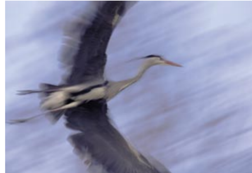
oben links | rechts: „Reiher“ Nikon D200, 4.0/200-400, ISO 100, 1/20 s „Spiegelung“ Nikon D200, lensbaby, ISO 100, 1/250 s unten: „Ziesel“ Nikon D200, 4.0/500, ISO 100, 1/400 s